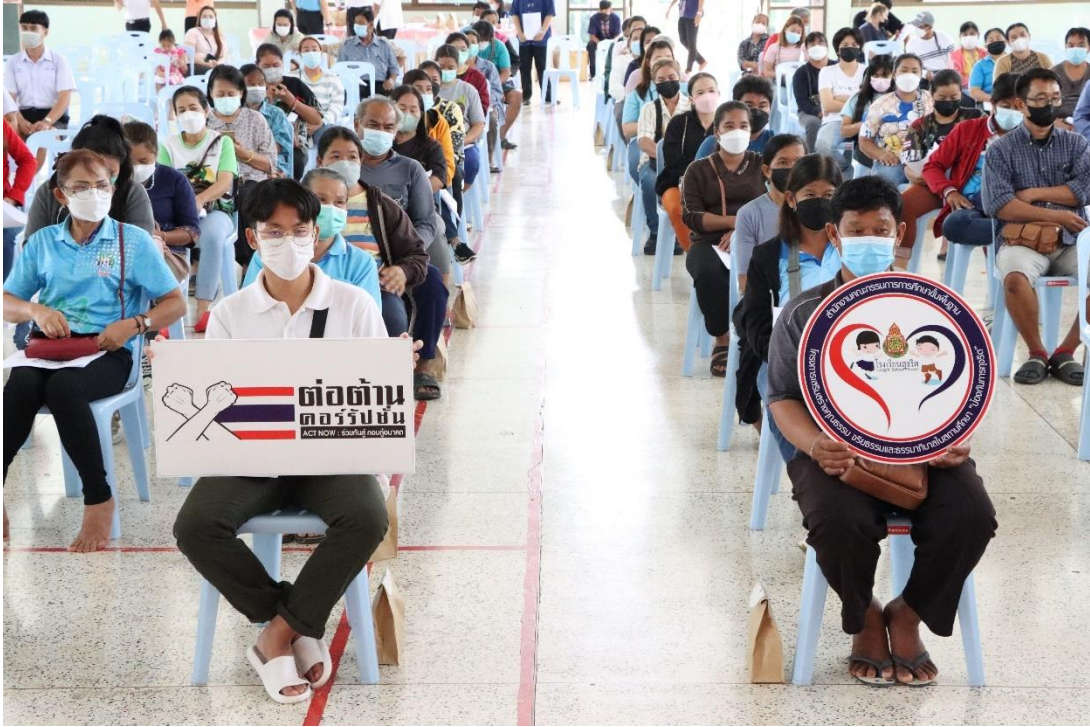
โรงเรียนงโกราชวิทยาลัยสร้างการรับรู้ให้กับผู้มีส่วนได้ส่วนเสีย